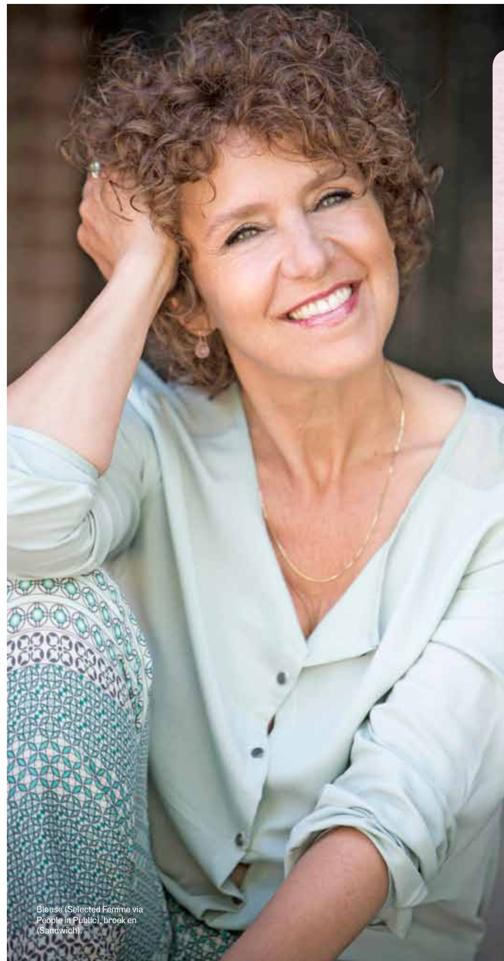
Blouse (Selected Femme via People in Public), broek en (Sandwich).